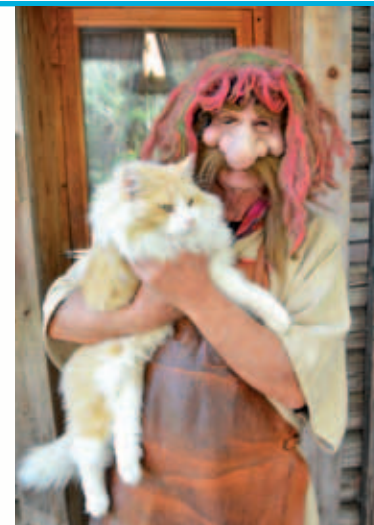
Trolles katt heter Trollmix

• ca 15.30 Besök hos Trolle. Vad gör Trolle? Vi följer Trollstigen som leder oss fram till Trolle och hans vänner.